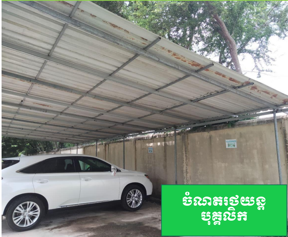
ចំណាត់ថ្នាក់ បុគ្គលិក