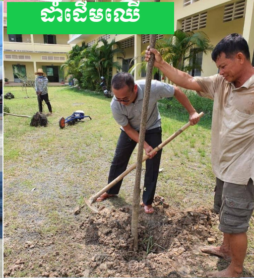
ដាំដើមឈើ