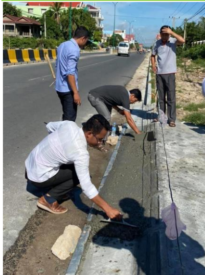
ចាក់សាបម្រុង ផ្លូវចូល