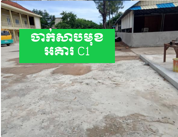
ចាក់សាបម្រុង អគារ C1