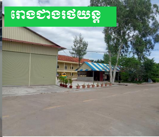
រោងជាងរថយន្ត