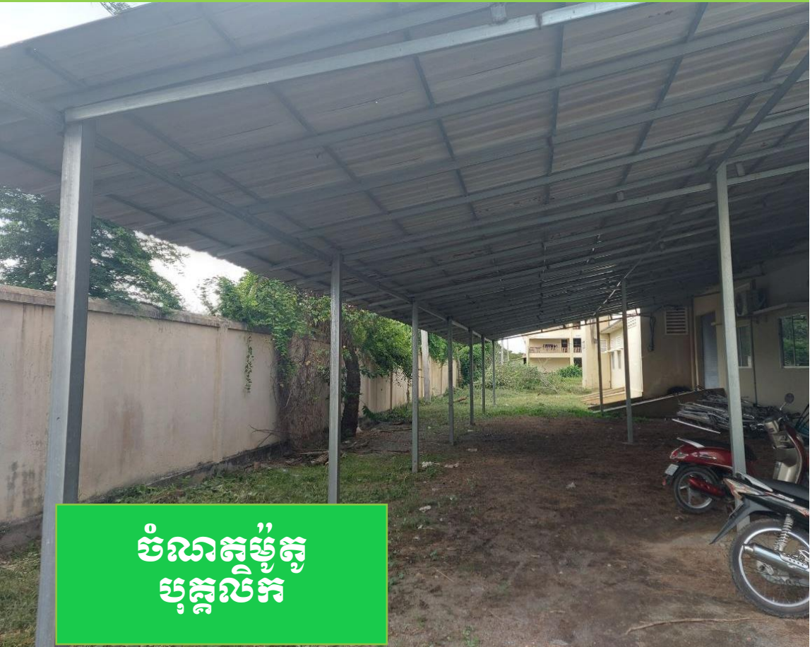
ចំណាត់ថ្នាក់ បុគ្គលិក